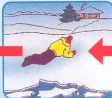
Проползти 3-4 метра по своим следам