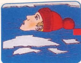
Не погружаться в воду с головой