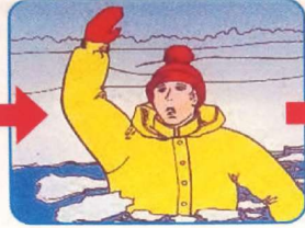
Не паниковать, позвать на помощь