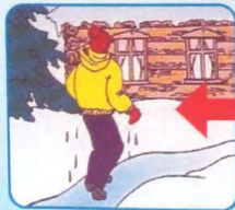
Не отдыхая, бежать к близкому жилью