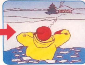
Выбираться в сторону, с которой произошло падение