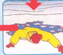
Наползть на лед, раскинув руки в стороны